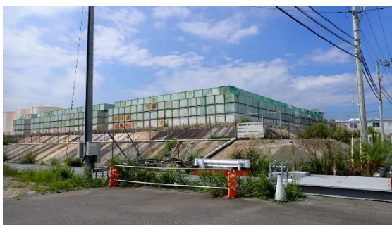
(写真1-1) 一時保管エリアJの外観