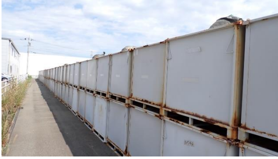
(写真3) エリア周囲におけるコンテナの仮置き状況