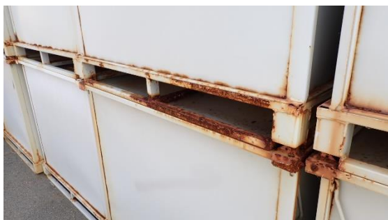
(写真2) 錆が生じ腐食しているコンテナの例