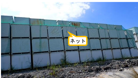
(写真1-2) 一時保管エリアJのコンテナ保管状況の例