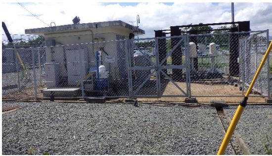
(写真 2 ①) MP-6外観