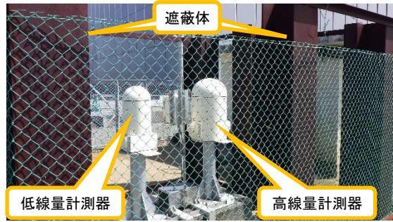
(写真 1 ②) MP-6検出器