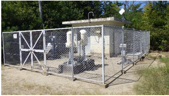
(写真 1 ①) MP-5外観