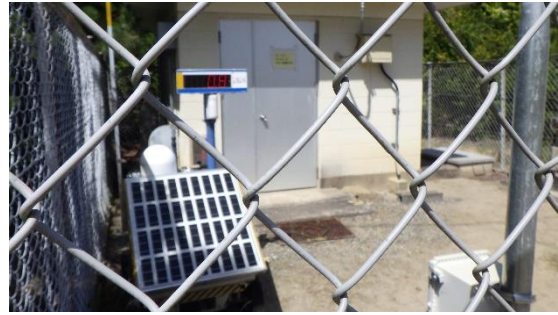
(写真 1 ②) MP-5内の可搬型計測器