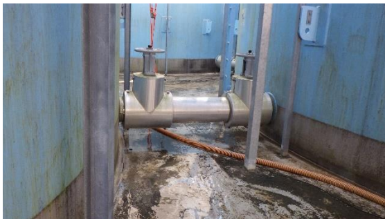
(写真 3 - 2) 連結管の状況の例②