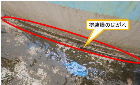
(写真 3 - 1) タンク下部周囲の防水塗装はがれ状況の例 (B 5 タンク)