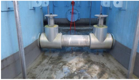
(写真 2 - 2) 連結管の状況の例①