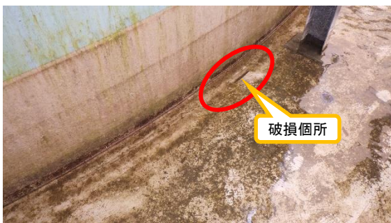
(写真2-1) タンク下部周囲の防水塗装一部破損 の例 (B4タンク)