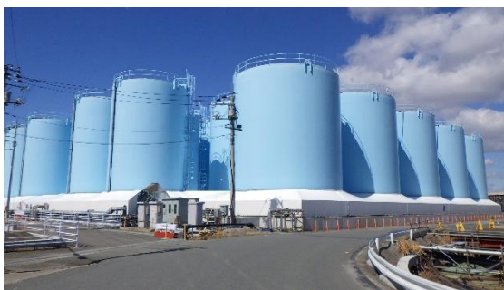
(写真1-1) Bタンクエリア外観 (南東側から撮影)