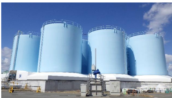
(写真1-2) B南タンクエリアの外観 (南東側から撮影)