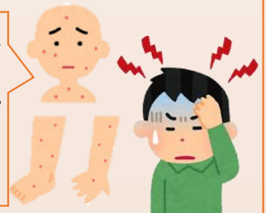
梅毒発生状況（全国・福島県）

発疹は、最初は平坦ですが、内部に液体や膿が溜まって腫れてくる場合があります。腫れた発疹にはカサブタができ、最終的にはカサブタが剥がれ落ちます。