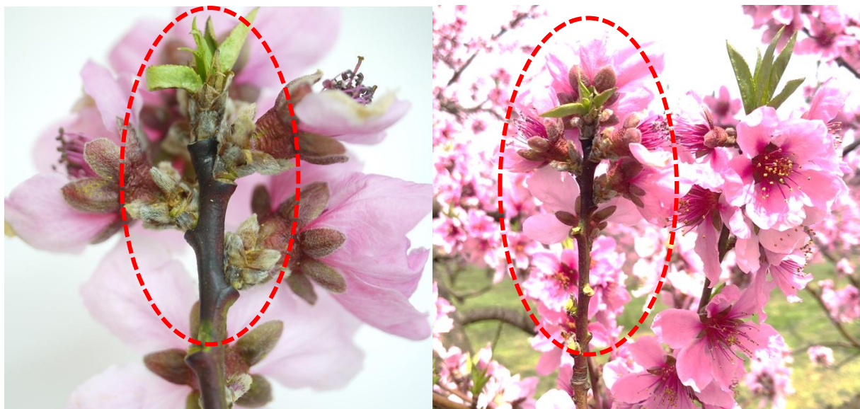
図2 春型枝病斑の発生（新梢葉の生育不良と枝の変色、令和4年4月13日撮影）