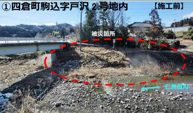
写真 現在、災害復旧工事を実施している代表的な箇所を掲載しています。