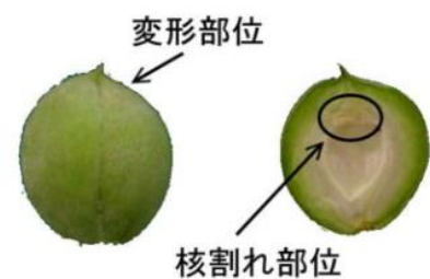
図 2 核頂部の障害と果頂部の変形

5 月下旬から 6 月中旬にかけては新梢の生育が最も盛んな時期で、樹勢の強い樹や若木等では樹冠内部が混み合ってきます。樹冠内部や主枝、亜主枝の基部、側枝の基部などから発生する徒長しやすい新梢は、早めに摘心や夏季せん定を実施し、適正な管理を心がけましょう。なお、樹勢の弱い樹では葉面積の確保を優先し、夏季せん定は行わないか最小限に止めましょう。