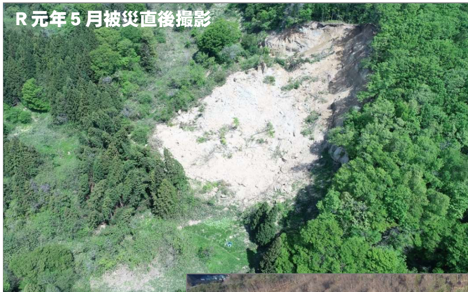
R元年5月被災直後撮影

令和元年5月13日に確認されました、喜多方市山都町相川地内における藤沢地区の地すべりにつきましては、同年11月からの崩落土砂撤去工事に着手し、現在は法面対策工事を実施中です。これからも、早期の完成に向け工事を進めてまいります。