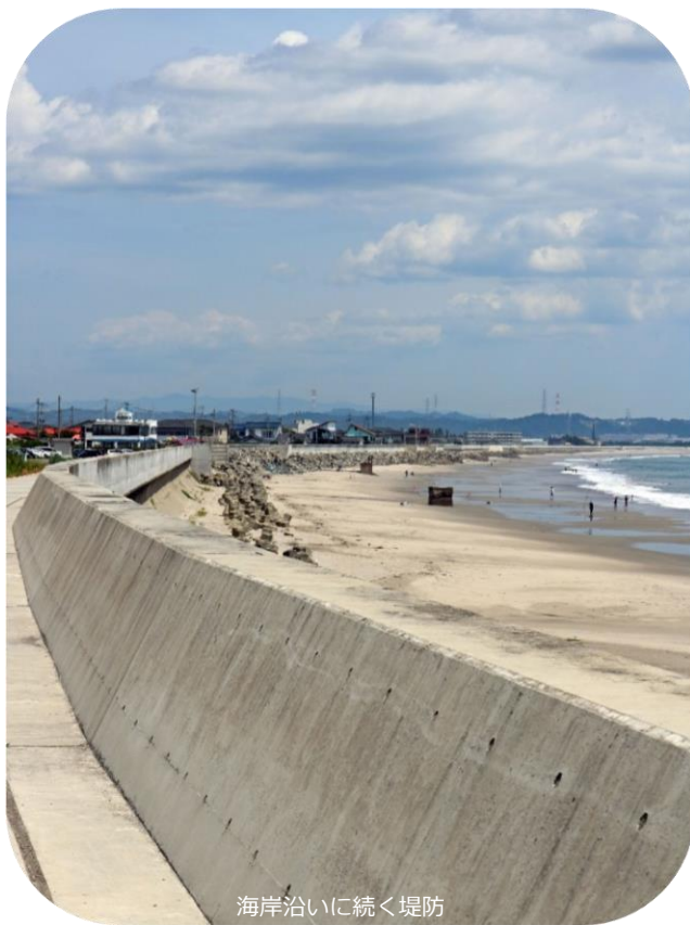
海岸沿いに続く堤防