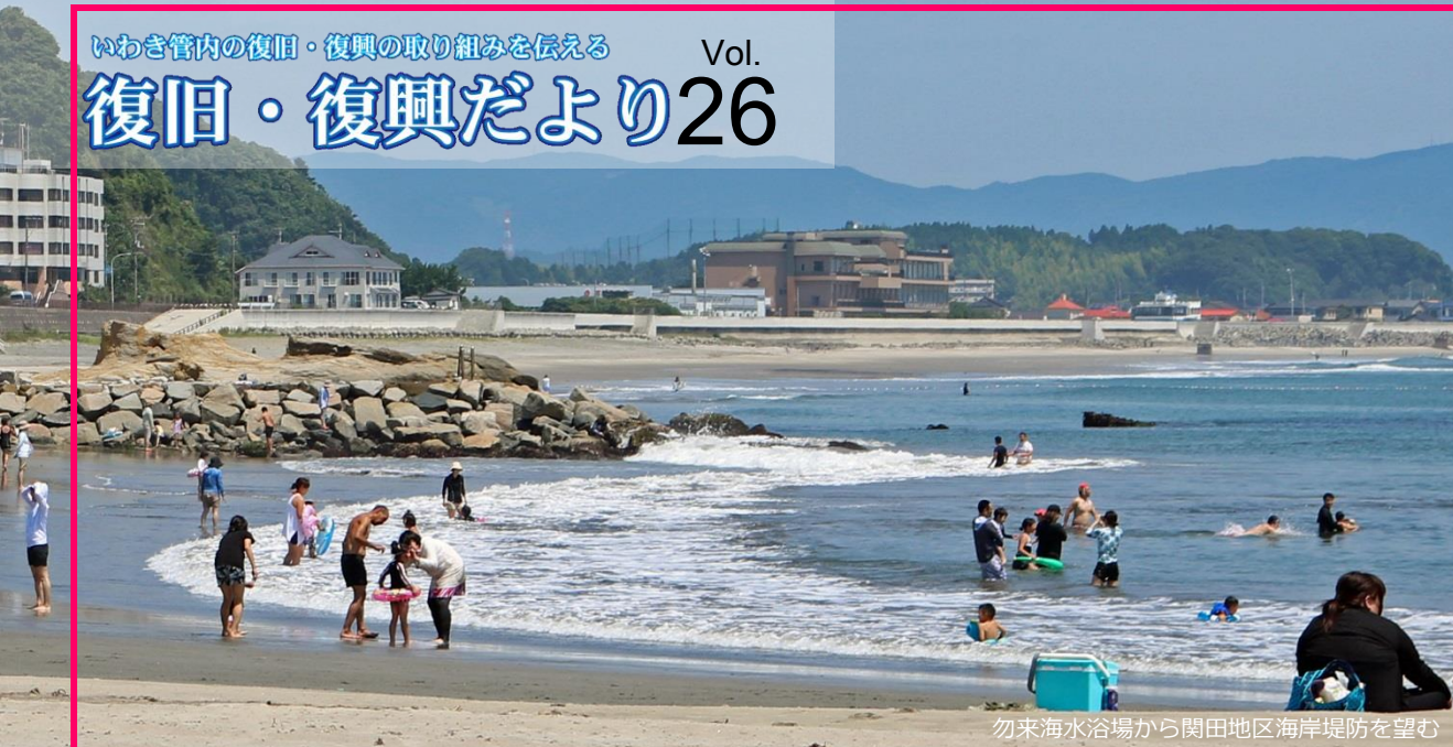
勿来海水浴場から関田地区海岸堤防を望む

— 海岸堤防をかさ上げし 安全が確保された関田地区海岸 この夏海を守った 市民団体の活動 — 海水浴に来る人が安心して、そして安全に —