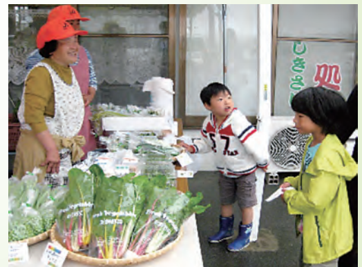
（写真）直売所合同イベントの様子

相馬地方の農業復興を牽引し、皆様へ「相馬の旬」と「農家の愛」をお届けする直売所。もう、立ち寄らずにはられません！