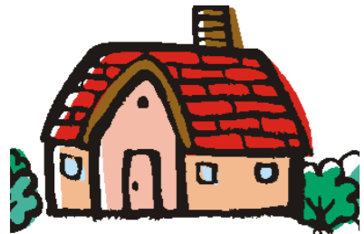
【住宅、店舗、物置等の新築】