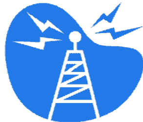
【道路、橋、鉄塔等の設置】