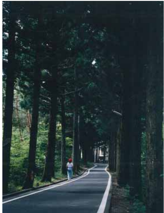
山本不動尊へ通ずる杉並木

良好な自然的環境の保全を図るため、現行の各種法令における規制（河川区域、農振農用地区域、保安林区域等）のほか、緑地協定の締結などにより、都市計画制度以外の手法との連携を進めるものとする。