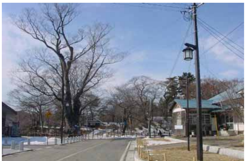
棚倉町のシンボル“大ケヤキ”と棚倉城跡