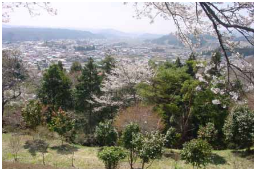
赤館公園から棚倉町の市街地を望む