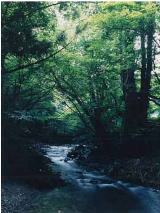
八溝山から湧き出る久慈川の清流

特に、美しい水や緑と歴史的・文化的資源を大切にし、都市活動を展開していく本区域は、町の将来像に“緑と歴史にいだかれてやすらぎを育む町”を掲げていることなどから、これまで培われ、育まれてきた「城跡とお濠のあるまち」のイメージを本区域の個性として、後世に引き継ぐことに努める。