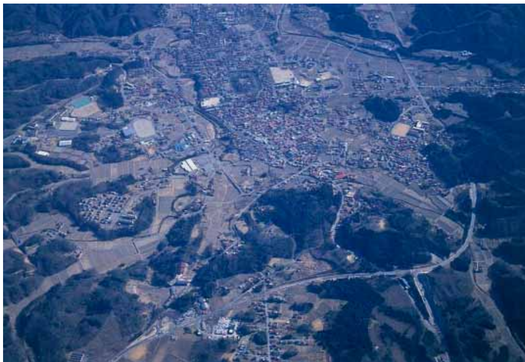
上空から棚倉町の市街地を望む

すべての人が安心して居住できるよう、ユニバーサルデザインの考え方を取り入れた都市づくりを進め、より高質な道路交通施設などの整備に取り組む。