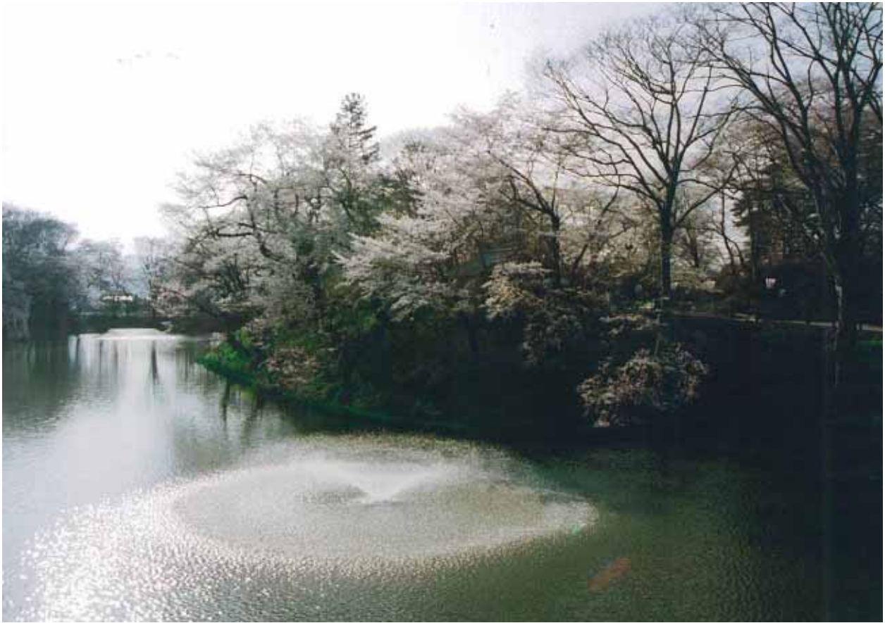
濠の桜が咲きほこる亀ヶ城公園（棚倉城跡）