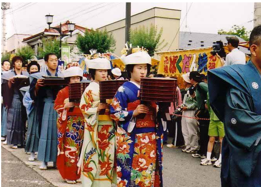
田島祇園祭「七行器行列」