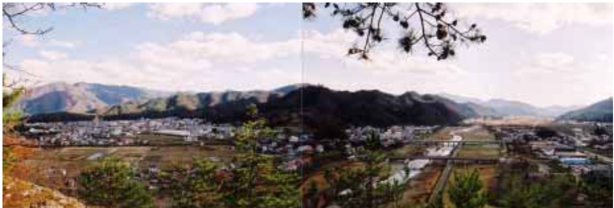
高野地区から市街地を望む

豊かな自然のなかで育まれた“もてなし”の心で、首都圏など他地域との交流の「要」となるまちづくり