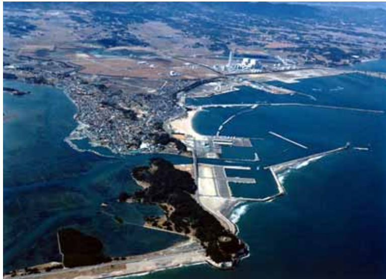
相馬港と松川浦（相馬市・新地町）