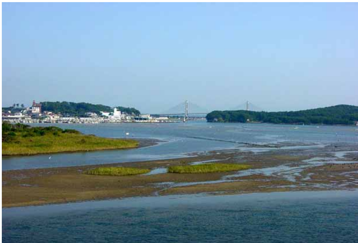
松川浦県立自然公園