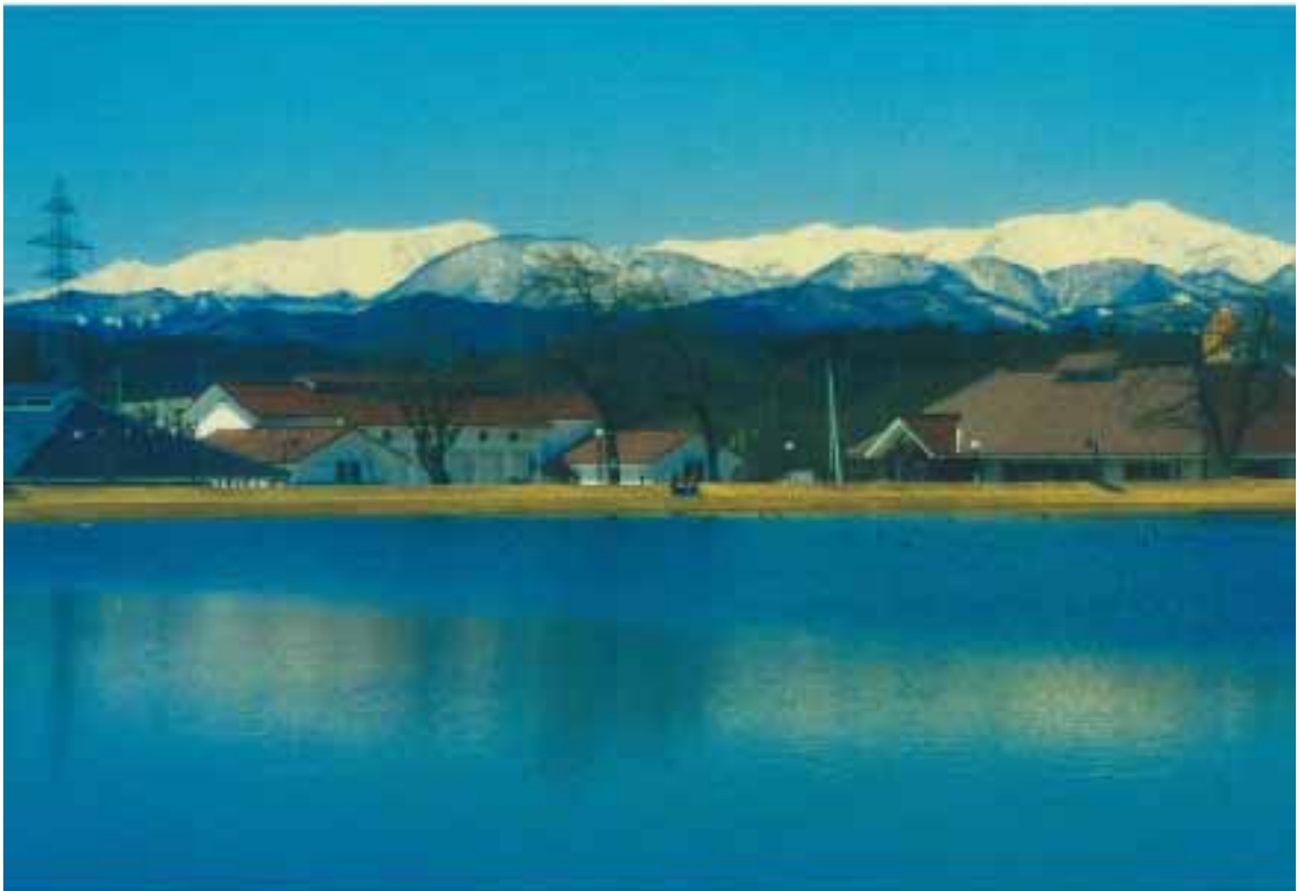
道の駅「喜多の郷」より飯豊連峰を望む

また、市街地を取り巻く広大に広がる田園景観、濁川、田付川などの河川景観、この背景にそびえる飯豊山、雄国山、磐梯山などの山岳景観は、田園と背景の山とが一体となって郷土景観を形成している。