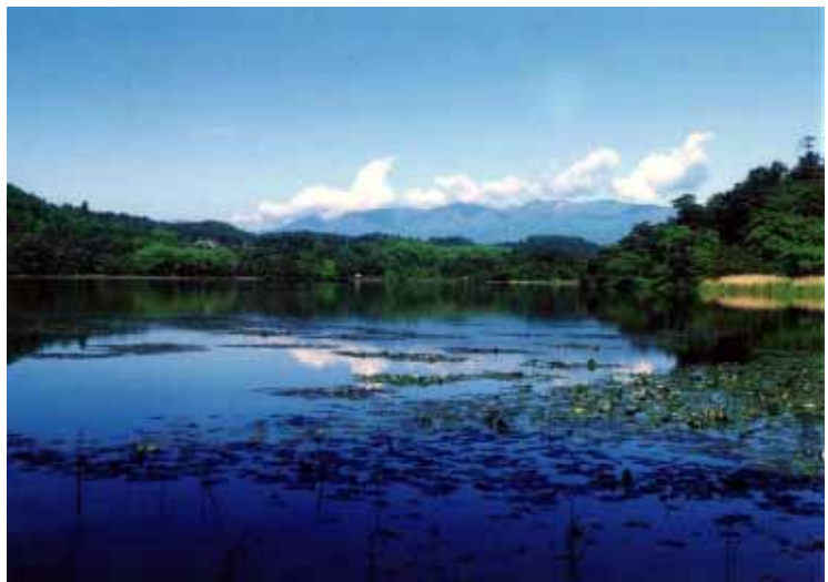
夏の南湖から那須山系を望む

特に、美しい水や豊かな緑と歴史的・文化的資源を大切に、都市活動を展開していく本区域は、水に癒される「源流の里」として、これまで培われ、育まれてきた「交流・連携する都市群」のイメージを本区域の個性として、後世に引き継ぐことに努める。