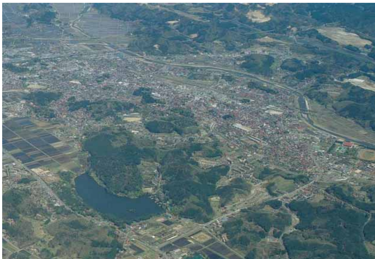
上空より白河市の市街地を望む