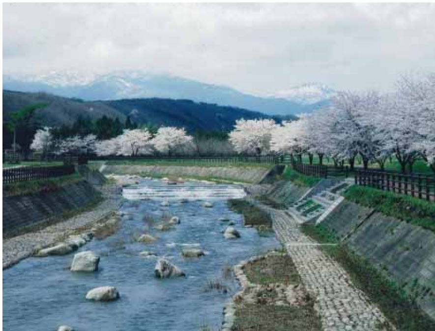
阿武隈川水系堀川から那須山系を望む

すべての人が安心して居住できるよう、ユニバーサルデザインの考え方を取り入れた都市づくりを進め、より高い文化・教育・医療環境の整備と良好な道路網の形成に取り組む。