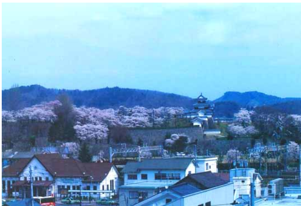
ＪＲ白河駅から小峰城を望む

本区域内に点在する農村集落地は、歴史の中で培われてきた郷土の景観を有しており、清流や里山などから構成される源流の里として、その保全により、景観を維持する。