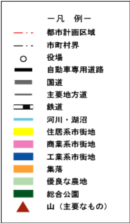
土地利用方針図（参考）