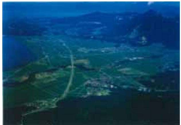
上空から見た猪苗代町・磐梯町