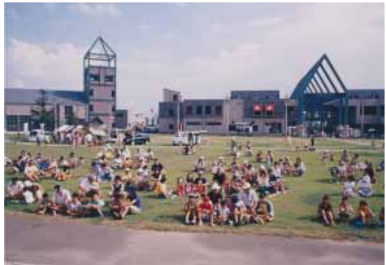
磐梯町イベント風景