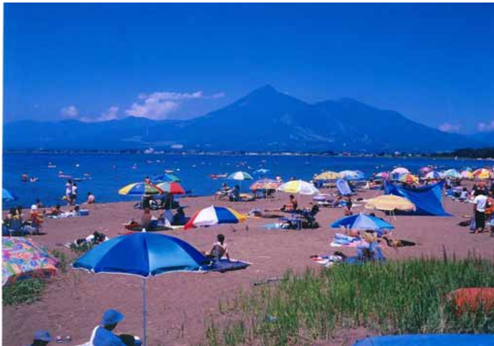
猪苗代湖から磐梯山を望む