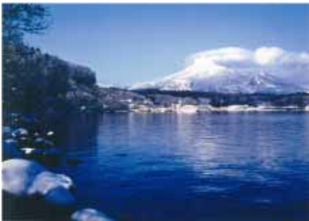
冬の猪苗代湖と磐梯山

一方、潤いのある都市環境を形成するため、市街地周辺に存在する豊かな自然や緑を有効に活用し、必要に応じて建物等の高さに十分配慮しながら、都市機能と自然環境の調和を図るとともに、福島県景観条例の「磐梯山・猪苗代湖周辺景観形成重点地域」の指定に基づき、屋外広告物の制限及び広域サイン計画に即したまちづくりを目指すことが課題である。