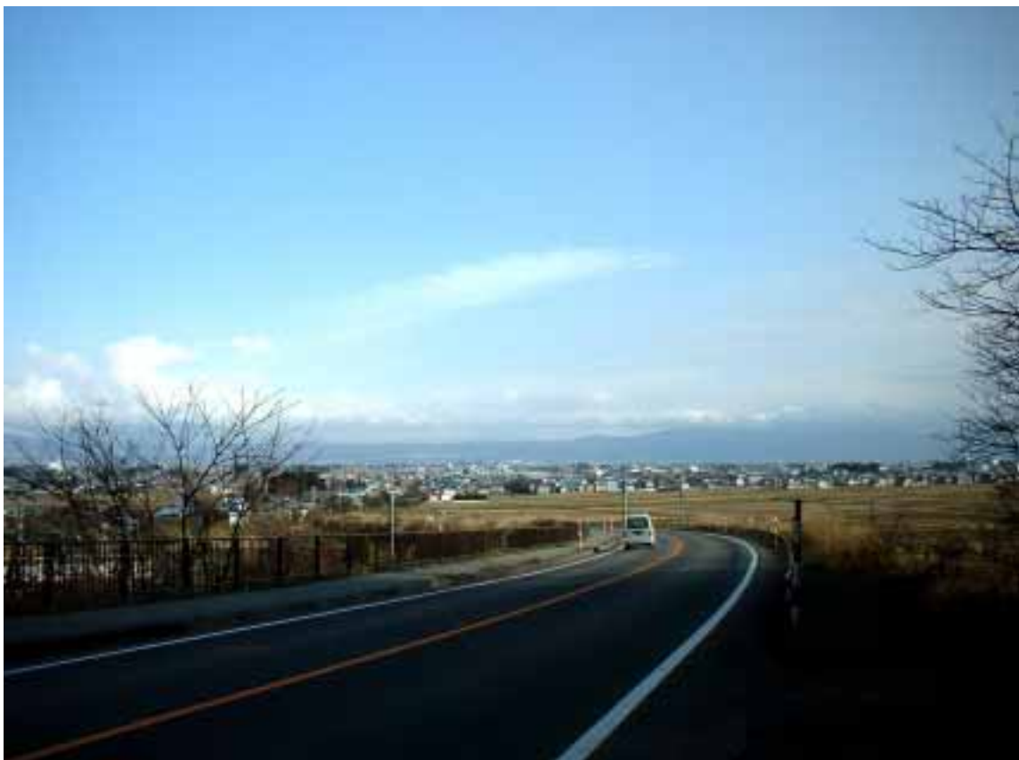
会津坂下町市街地

また、旧街道沿いに残る古い商家や蔵など往時の面影を残す街並み、塔寺・気多宮などの宿場跡、「恵隆寺観音堂（立木観音堂）」などの史跡は、歴史的景観並びに資産として今後も保全していくとともに、400年余りの伝統を誇る「初市大俵引き」などの伝統文化についても、次世代への伝承を図っていく。