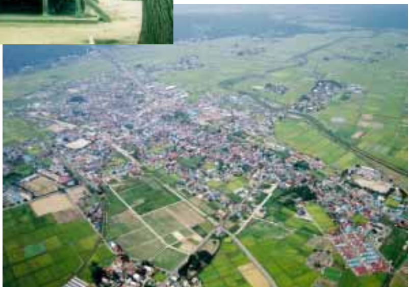
上空から見た会津坂下市街地