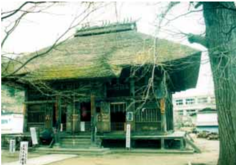
恵隆寺観音堂（立木観音堂）

「恵隆寺(立木観音)」などの仏教に関する文化財や越後街道の宿場町として発展してきた歴史的経緯など、会津坂下町の個性を生かした「誇り」のもてるまちづくり