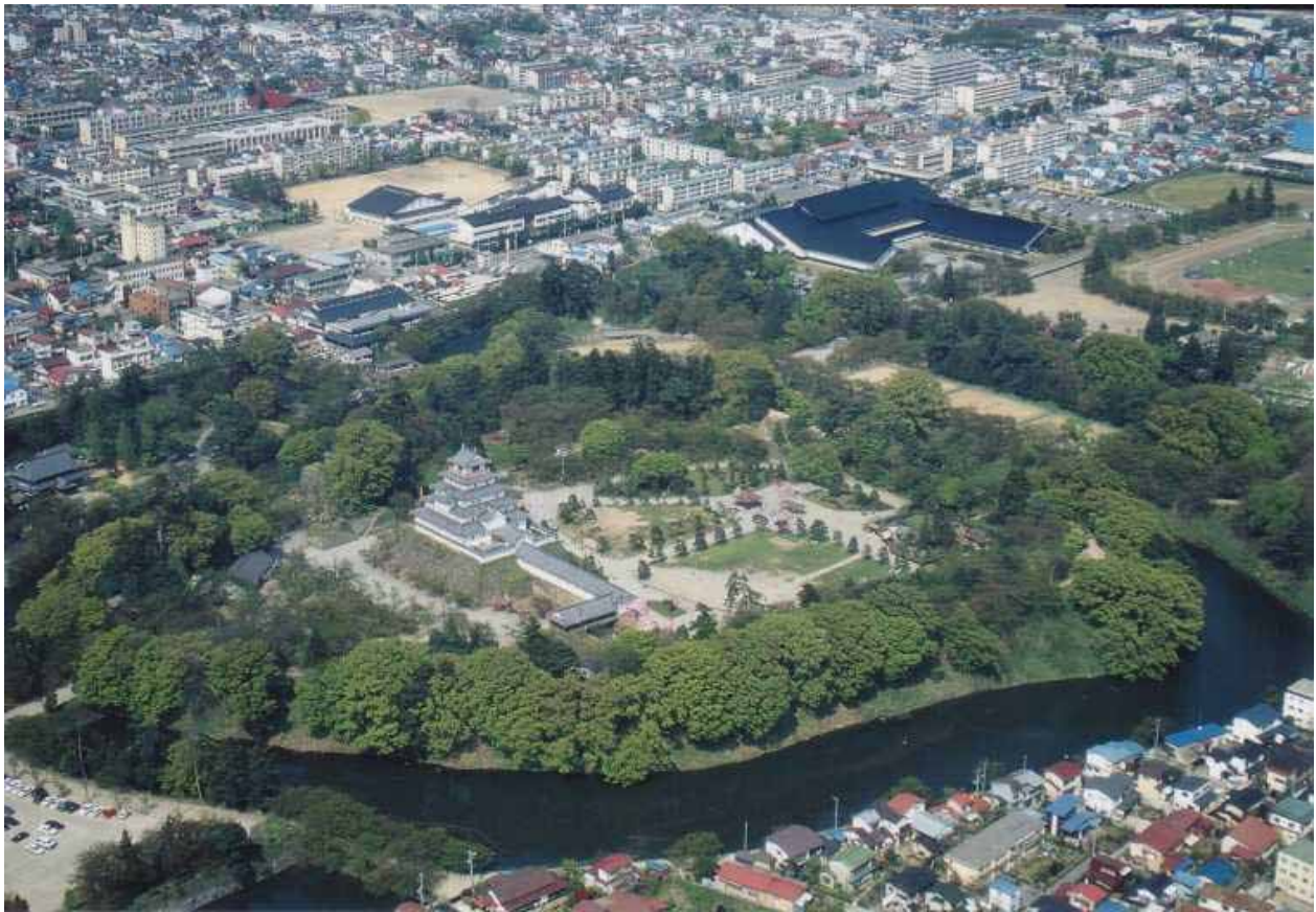
空から見る鶴ヶ城周辺