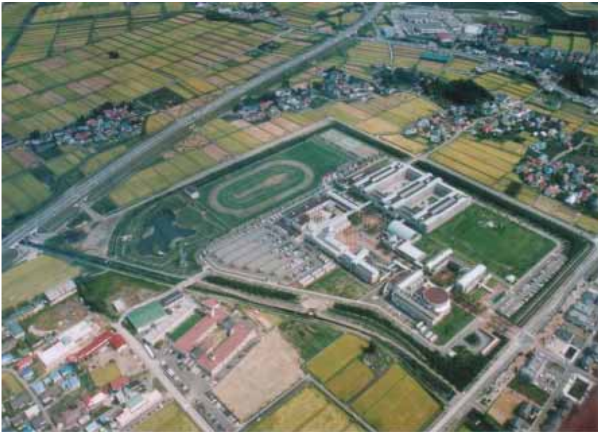
県立会津大学周辺

会津若松市を中心とした総合的な都市機能の充実強化、定住基盤の整備、幹線道路網等の整備による会津地域生活圏の一体的な振興。