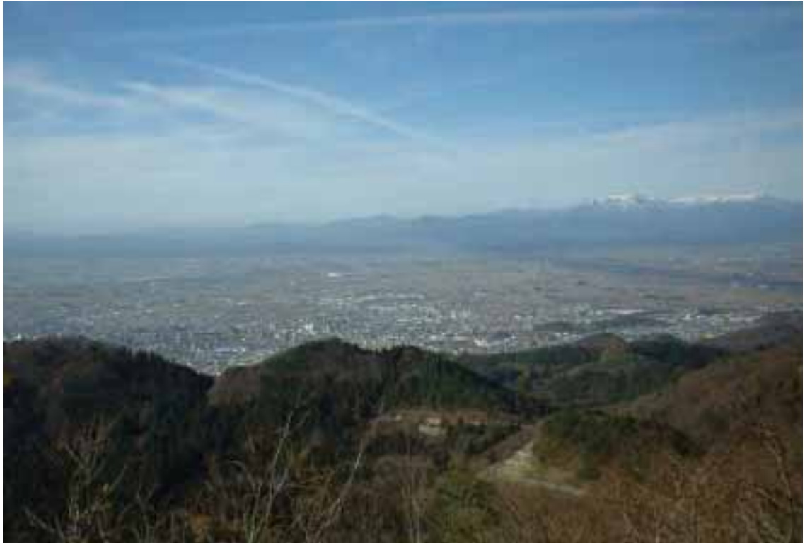
背あぶり山から見た会津盆地