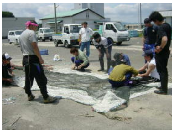
図1 選択性漁具の製作 (H16年度)

底曳き網は、年間の操業日数、操業時間が長いため、多くの部会員が協力して試験等に取り組める時間が確保できず、試験を繰り返したりすることが困難であった。3年間の取り組みで得られた成果をもとに、今後機会を捉えて、実操業で使用可能な選択性漁具の完成を目指したい。