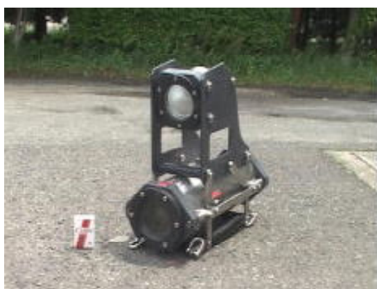
図8 水中カメラ (H17年度)