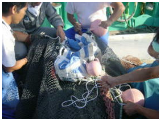
図6 カイトの取り付け (H17年度)