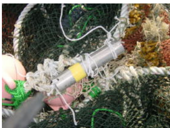
図12 深度計の取り付け (H18年度)