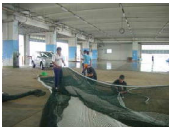
図10 選択性漁具の改良 (H18年度)