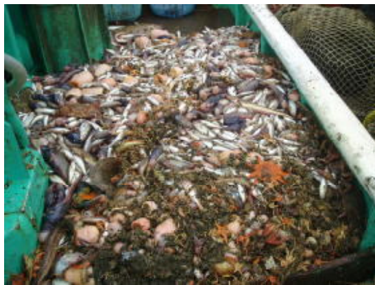
図4 魚取り部の入網物 (H16年度)