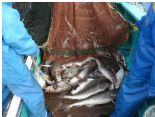
図11 カバーネットへの入網物 (H18年度)