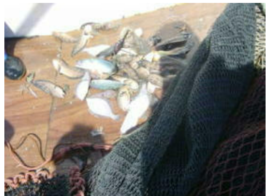
図7 カバーネットへの入網物 (H17年度)