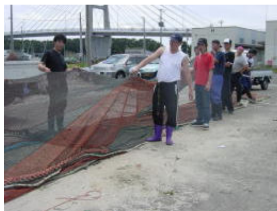
図2 カバーネット部分 (H16年度)