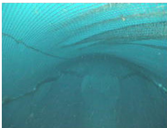
図9 間口からの網内の映像 (H17年度)