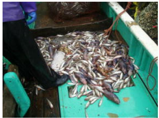
図5 カバーネットへの入網物 (H16年度)