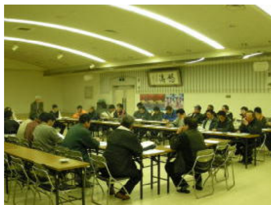
図2 漁業者による全体会議