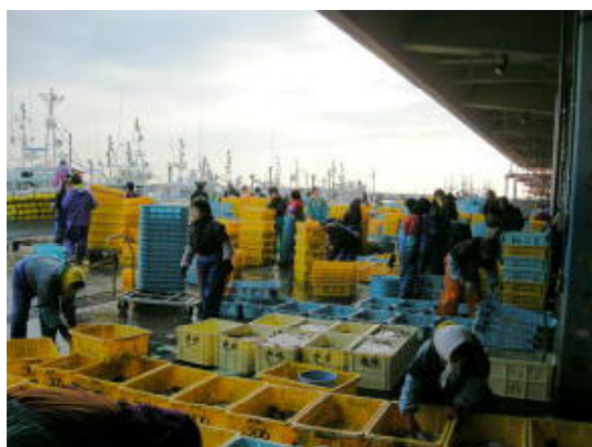
図1 1月に見られるセリの順番待ち

マガレイ小型魚保護の取り組みについては、規制サイズのアップやさらなる目合いの拡大といった意見もある。現在の取り組みの成果を皆が実感できれば、実現は可能と考えられる。また、さし網漁の重要な対象種であるヒラメやマコガレイ、さらに、県が放流効果調査を続けているホシガレイについて、資源管理効果をより高めるための取り組みへの意見も出されている。漁業者自らが考え、行動し、漁業経営の向上につなげていきたい。