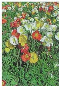
アイランドポピー