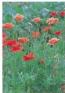
ヒナゲシ(虞美人草)