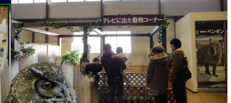
テレビに出た動物コーナー