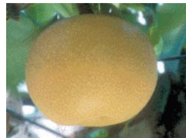
今後注目される品種「涼豊」