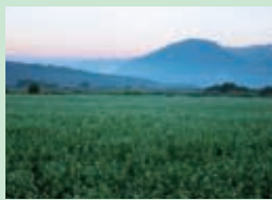
そば畑(下郷町猿楽台地)

南会津地方では、約380haの畑でそばが栽培されています。8月下旬~9月上旬頃にはそばの花が開花し、写真撮影などを目的に、多くの観光客がそば畑を訪れます。特に広大なそば面積を誇る下郷町猿楽台地のそば畑は、まさに圧巻の一言です。