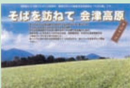
そばを訪ねて 会津高原そばマップ