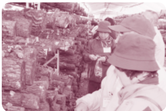
「しいたけって、 こんなふうに見えるのね～」 しいたけハウスでの収穫の様子(岩代町)

※いずれも、県北農林事務所管内で平成14年秋冬期に行われたファンクラブのイベントです。