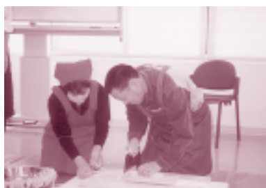
屏風折りにして、切ります。