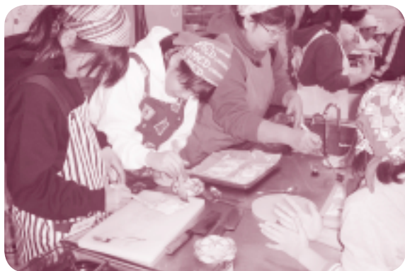
とったばかりのりんごで 「アップルパイ」づくり 「みんな、とっても上手です！」(福島市)

地場の野菜を使った 今、ブームの「キムチ」づくり 「食べ頃になるのが とても楽しみです。」(霊山町)