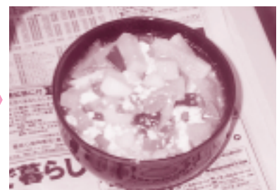
「けんちんうどん」のできあがり。