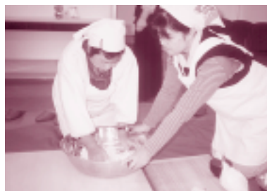
がんばってこねましょう。