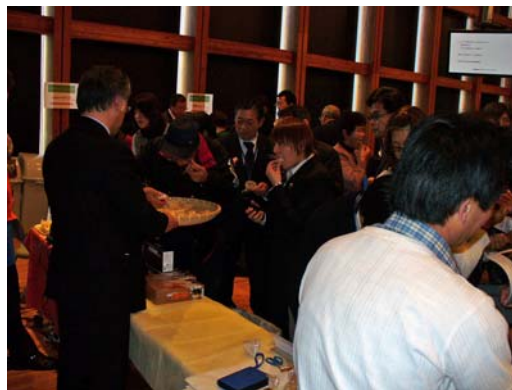
米粉製品試食の様子