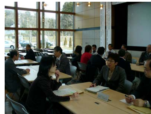
ニーズマッチングの一コマ