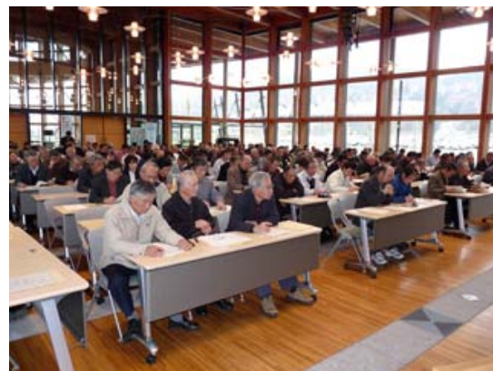
研修生の受講状況