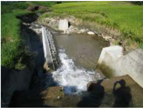
8/28~29豪雨災害による頭首工(護岸)被害(田村市)