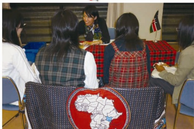
ケニアの活動体験に興味津々

元青年海外協力隊員が、派遣されていたそれぞれの国の紹介や現地での活動紹介、クイズ等を行います。それらを通して、開発途上国の国々へ行って実際に体験したようなおもしろさを味わいました。