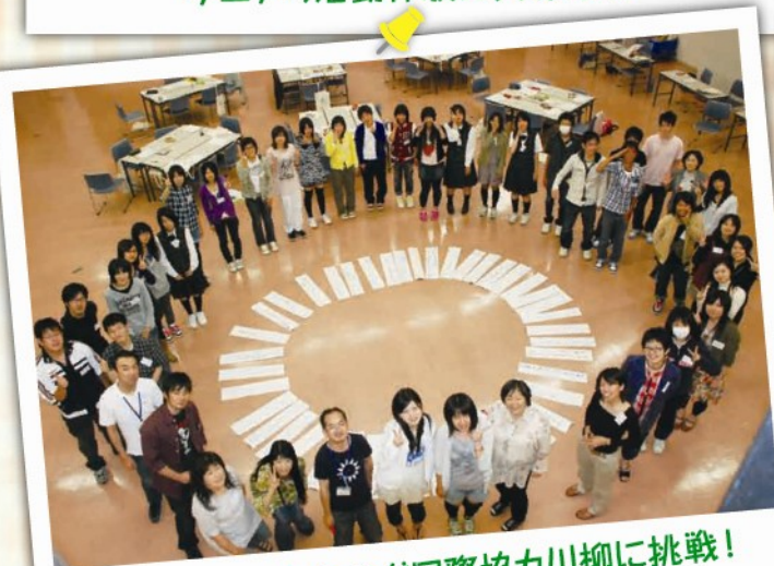
最後は一人ひとりが国際協力川柳に挑戦!