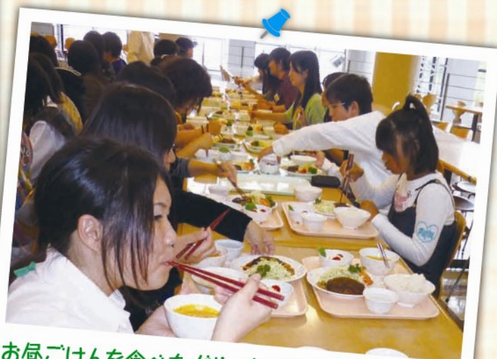
お昼ごはんを食べながら、食の格差を考えました。