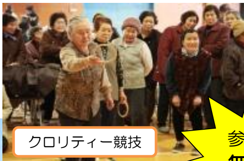
クロリティー競技