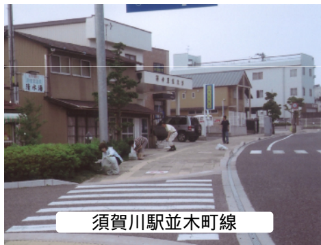
須賀川駅並木町線

平成21年6月現在、県中管内において、うつくしまの道サポート制度に18団体、うつくしまのサポート制度に5団体の合計23団体が協定を締結し、道路や河川の清掃・美化活動を行っています。