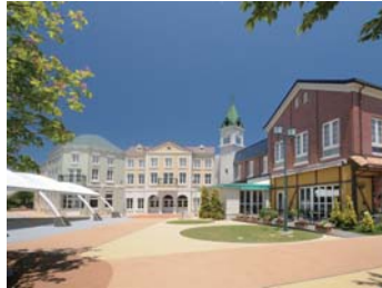
❖ 에너지관 【토미오카마치: K3】 후쿠시마현 후타바군 나라히마치 오오자 나미쿠라자 코베마사쿠12