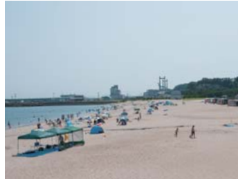
❖ 해수욕【지도참조】 아름다운 해안선이 연속되는 후쿠시마현의 해안선