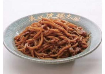
❖ 나미에야키소바【나미에마치: I2】 회장: 시노부토모리 (국도13호), 개회일: 8월제1금, 토요일