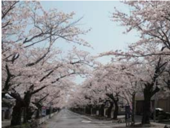
❖ 요노모리공원【토미오카마치: K2】 후쿠시마현 후타바군 토미오카마치 요노모리 2조메

1000년의 전통을 배경으로 센고쿠에마키(전국시대의 그림두루마리)의 내용을 재현하는 소마노마오이가 거행되는 역사가 깊은 지역. 풍광명미(자연경관이 맑고 아름다움)의 마츠카와우라, 사쿠라의 터널이 아름다운 요노모리공원, 나미에야키소바, 바다낚시등 다채로운 즐거움이 있다.