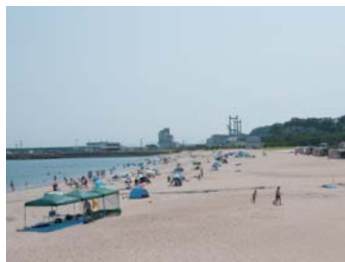
❖ 海水浴【參照地圖】 福島縣的延綿不斷的、秀美的海岸線