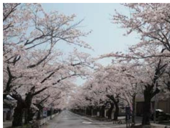
❖ 夜之森公園【富岡町：K2】 福島縣雙葉郡富岡町夜之森北 2 丁目

相雙地區位于福島縣東北部、面向太平洋。在其境內有被稱為日本百景之一的松川浦海濱，春季前來趕海、夏季前來海水浴的游客熙熙攘攘。這是一個歷史悠久的地域。相馬野馬追節是一個已有 1000 年歷史的傳統活動。風光明媚的松川浦海濱、以迷人的櫻花拱洞美景而聞名的夜之森公園、江浪的炒麵、海邊垂釣等等均為它增添了無窮的魅力