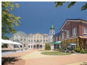
❖ 能量館【富岡町：K3】 福島縣雙葉郡檜葉町大字波倉小浜作 12