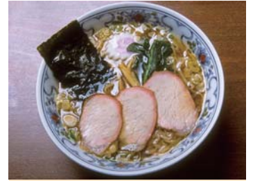
❖ 시라카와라면 [시라카와시 : 지도참조] 일본을 대표하는 현지의 간장맛 라면