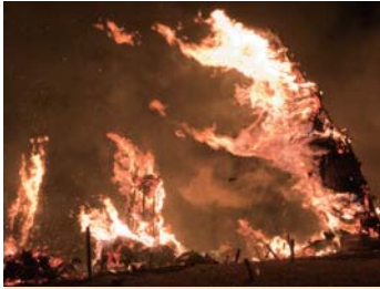
❖ 타이마츠아카시(10m 높이 정도로 거대한 장작들을 세워놓고 햇빛처럼 태우는 축제) [수카가와시 : C4] 후쿠시마현 수카가와시 미도리카와공원내 고묘잔. 개최일: 11월 2 토요일

옛부터 미치노쿠(토호쿠)의 현관으로, 역사안에 그 이름을 각인시켰던 시라카와. 온난한 기후로 시라카와시로부터 주변에는 풍부한 자연을 만끽할 수 있는 공원이나 호반, 플라워명소 등이 있어 여유롭고 느긋한 시간을 보낼 수 있다. 여름의 불꽃놀이와 가을의 타이마츠아카시(10m 높이 정도로 거대한 장작들을 세워놓고 햇빛처럼 태우는 축제)로 유명한 수카가와시는 후쿠시마공항이 있어 해외로부터 들어오는 현관이다.