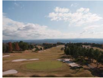
❖ 골프장 [지도참조] 웅대한 자연을 살린 매력적인 컨트리 클럽이 듬뿍!