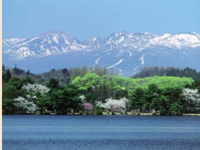
●후쿠시마현 시라카와시 난코 토호쿠신칸센 신시라카와역에서 택시로10분

❖ 난코공원 [시라카와시 : C4] 난코는 명군이면서 다도의 스승, 또한 뛰어난 정원사의 자이기도 했던 시라카와 영주 마즈다이라 사다노부(라쿠오코)에 의해 1801년에 조원되었던, 일본에서 가장 오래되었다고 여겨지는 공원. 조원해서 200년의 시간동안 갈고 닦인 공원은 소나무, 요시노자카라(벚꽃), 아라시야마의 단풍나무등, 사계절마다 단정하고 고상한 풍취를 찬사 받으며 꽃, 녹음, 물의 정원으로 시민으로부터 많은 사람들에게까지 애력을 주고 있다.