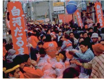
❖ 시라카와다루마시 [시라카와시 : C4] 후쿠시마현 시라카와시 상원가 (덴진마치, 나카마치, 혼마치). 개최일: 2월 11일