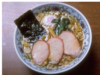
❖ 白河拉麵【白河市：參照地圖】 醬油味道的、代表日本的特產拉麵