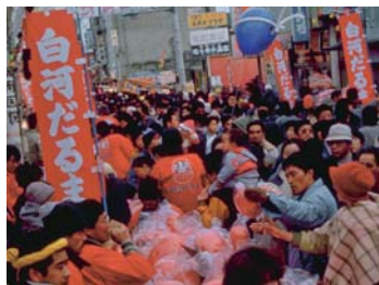
❖ 白河不倒翁集市【白河市：C4】 福島縣白河市商店街(天神町、中町、本町)；舉辦日：2月11日