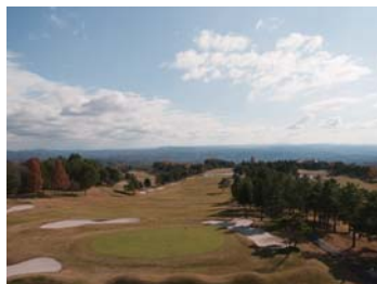
❖ 高爾夫球場【參照地圖】 有許多充分利用大自然資源，極具魅力的田園俱樂部