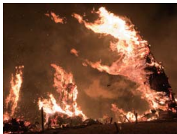
❖ 松明火把節【須賀川市：D3】 福島縣須賀川市翠丘公園內五老山；舉辦日：11月第二個周六

福島機場就建在以夏天的烟花大會、秋天的松明火把節而聞名的須賀川市，這裏已成為福島與世界相連通的窗口。