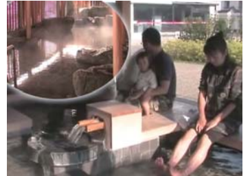
❖반다이아타미온천【코리야마시: E1】 코리야마 후쿠시마현 코리야마시 아타미마치 아타미4-406