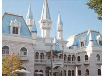
❖리카창호텔【오노마치】 후쿠시마현 타무라군 오노마치 오오노마치 오노마치 나카오리 51-3