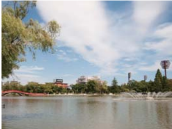
❖카이세이잔공원【코리야마시: B1】 후쿠시마현 코리야마시 카이세이1-5

또한 국가천연기념물로 지정된 미하루의 타키자쿠라와 증유동인 아부쿠마동, 미인의 탕으로 유명한 반다이아타미온천등의 자연도 만끽이 가능하다.