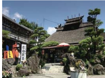
❖데코야시키【코리야마시: E4】 후쿠시마현 코리야마시 니시타마치 타카시바자 타테노 163