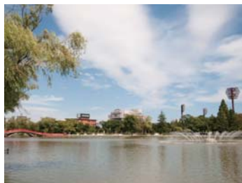
❖ 開成山公園【郡山市：B1】 福島縣郡山市開成 1-5

郡山位于福島縣的中央地帶，是福島縣內屈指可數的經濟都市。車站周邊是購物、美食的天堂，聚集有 Big-I 大廈、百貨店和餐飲店。此外，這裏的自然資源豐富。如被指定為國家天然紀念物的“三春瀧櫻”和“阿武隈洞(鐘乳洞)”、以美人之水而著稱的“磐梯熱海溫泉”等等。