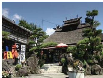
❖ 偶人宅第 (Dekou 屋敷)【郡山市：E4】 福島縣郡山市西田町高柴字館野 163