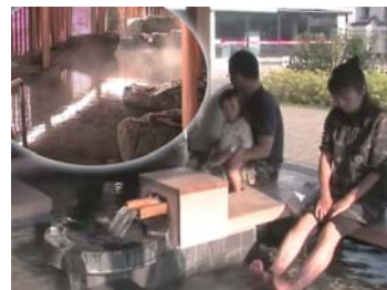
❖ 磐梯熱海溫泉【郡山市：E1】 福島縣郡山市熱海町熱海 4-406