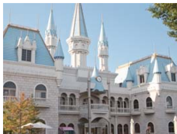
❖ 麗寶寶貝城【小野町】 福島縣田村郡小野町大字小野新町字中通 51-3