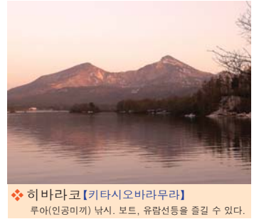
❖ 히바라코【키타시오바라무라】 루이(인공미끼) 낚시, 보트, 유람선등을 즐길 수 있다.