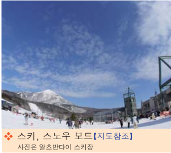
❖ 스키, 스노우 보드【지도참조】 사진은 알츠반다이 스키장

아이즈반다이산을 중심으로 한 우라반다이, 이나와시로코(호수)에 이르는 이나와시로-반다이고겐(고원)지역은 자연이 풍부한 곳. 트레킹(높은 산길을 걷는 것)이나 드라이브코스 이외에도, 스키장, 캠프장등의 레저시설이 충실하며, 고원리조트를 마음껏 만끽할 수 있다. 천엔권의 주인공인 노구치 히데오의 생가를 보존하고 있는 노구치 히데오 기념관을 시작으로, 메이지시대의 반다이산 분화기념관등 다채로운 관광명소가 다수 존재한다.