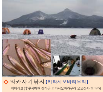
❖ 와카사기 낚시【키타시오바라무라】 히바라코(후쿠시마현 아마군 키타시오바라무라 오오야자 히바라)