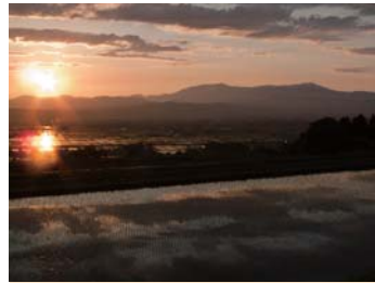
❖ 飯豐山【喜多方市】 從福島縣喜多方市熊倉町雄國眺望的景觀