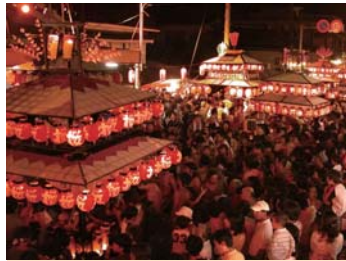
❖ 喜多方太鼓台節【喜多方市：C2】 每年 8/13 ~ 16 日舉辦