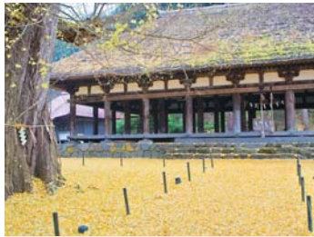
❖ 新宮熊野神社 長床【喜多方市】 福島縣喜多方市慶徳町新宮字熊野 2242

喜多方市被世人稱為“藏(倉庫)之町”。“藏”的外觀多種多樣，有粉刷白灰漿的；也有磚牆外壁的... 僅看這些懷古裝飾也是一種享受。現在有一部分“藏”仍作為商店(藏)、酒窖(藏)等來使用，還可以參觀“藏”內的構造。此外喜多方還是日本三大拉麵之一 --- 喜多方拉麵的故鄉，每個拉麵店都各具特色，定會讓您大飽口福。