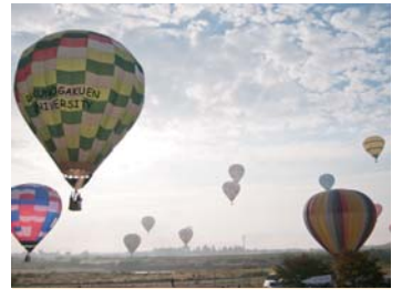
❖ 鹽川氣球節【喜多方市】 每年10月第3個週六、週日，在日橋川綠地公園自由廣場舉辦