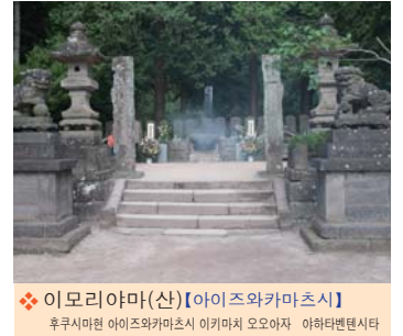
❖ 이모리야마(산)【아이즈와카마츠시】 후쿠시마현 아이즈와카마츠시 이키마치 오오야자 아와타번텐시타