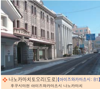
❖ 나노카마치토오리(도로)【아이즈와카마츠시: B1】 후쿠시마현 아이즈와카마츠시 나노카마치

쵸카마치(전국시대부터 에도시대까지 다이묘가 거주하던 성을 중심으로 발달한 마을)로 번성했던 역사깊은 거리. 아이즈지방 최고의 관광도시이기도 하다. 시내에는 츠루가쵸(성)를 시작해서 옛스런 정취를 전하는 거리들이 많이 남아있으며, 나노카마치에서는 그런 마을거리를 보면서 식사나 쇼핑을 즐길 수 있다. 또한, 전통있는 향토요리나 말고기육회, 향토술, 최근에는 소스돈카츠덮밥등의 향토색 짙은 메뉴가 풍부하다.