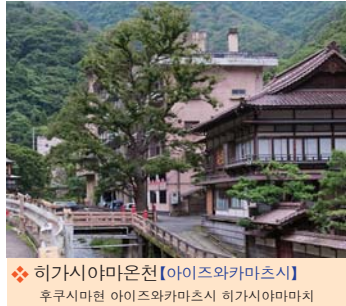
❖ 히가시야마온천【아이즈와카마츠시】 후쿠시마현 아이즈와카마츠시 히가시야마마치