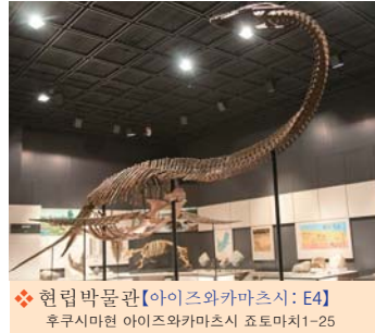
❖ 현립박물관【아이즈와카마츠시: E4】 후쿠시마현 아이즈와카마츠시 쵸토마치1-25