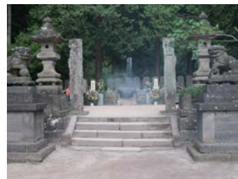
❖ 飯盛山【會津若松市】 福島縣會津若松市一箕町大字八幡井天下