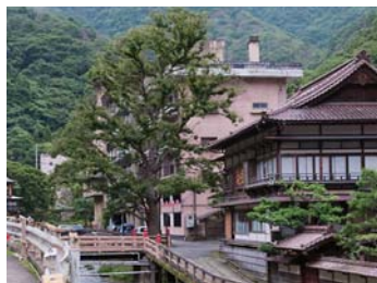
❖ 東山溫泉【會津若松市】 福島縣會津若松市東山町