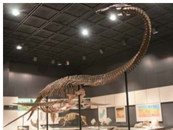
❖ 縣立博物館【會津若松市：E4】 福島縣會津若松市城東町 1-25