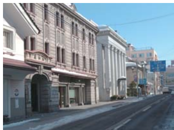
❖ 七日町街【會津若松市：B1】 福島縣會津若松市七日町

而且這裏還有傳統鄉土料理、生馬肉片、當地特產醇釀和新款醬汁炸豬排蓋飯等鄉土特色美食供您品嚐，品種豐富。