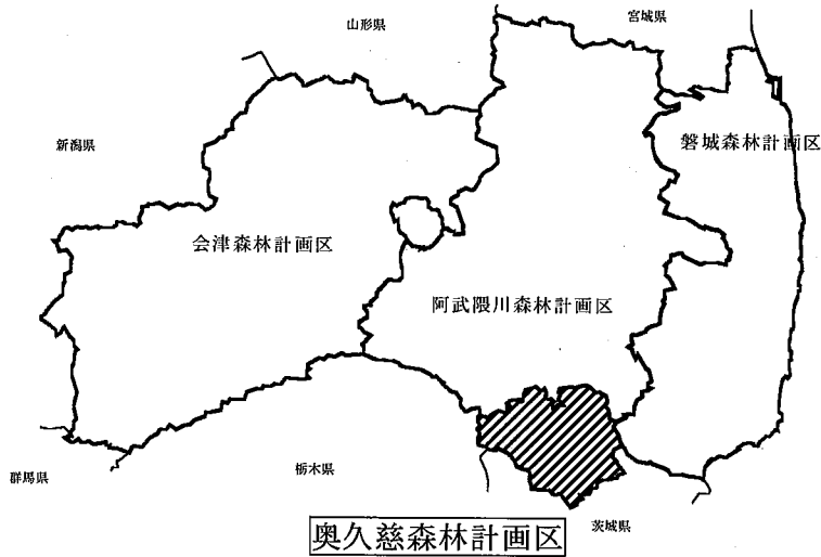
福島県の森林計画区