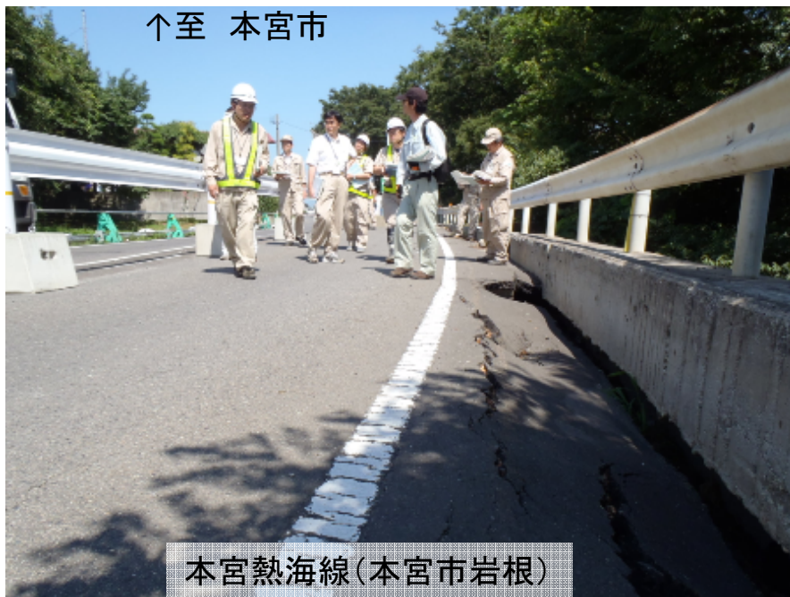
本宮熱海線(本宮市岩根)