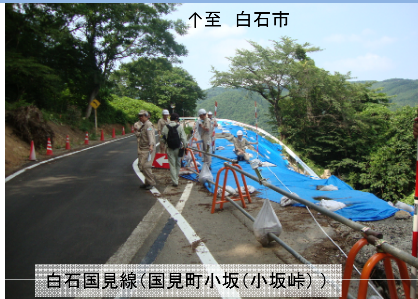
白石国見線(国見町小坂(小坂峠))