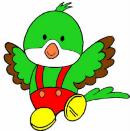
玉川村のイメージキャラクター 山鳩の「クックちゃん」