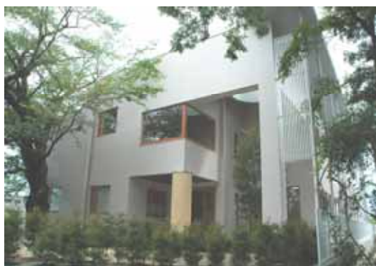
新事業研究・創出の拠点となる インキュベーションセンター