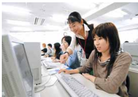
I T 資格に関連する講座の様子