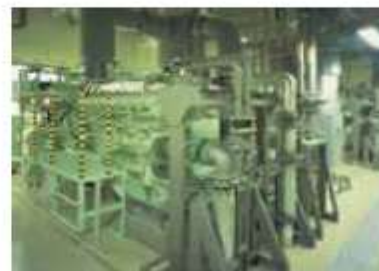
1,000kWクラス ガスエンジン発電設備