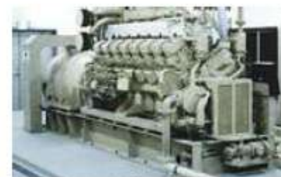
1,000kWクラス ディーゼルエンジン発電設備