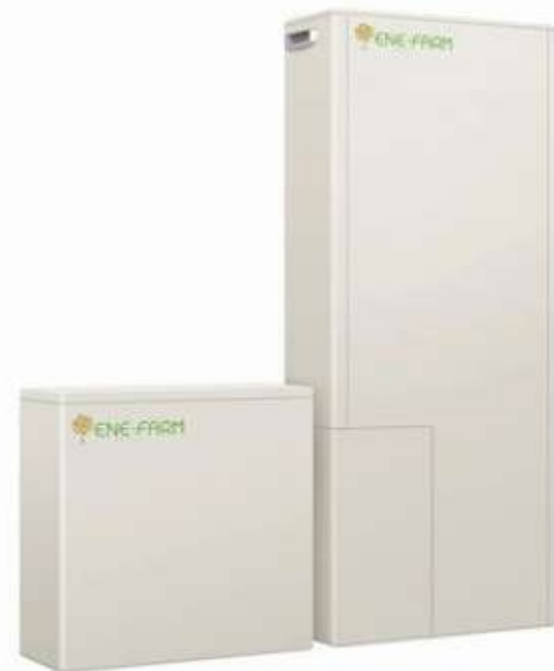
<家庭用燃料電池システム「エネファーム」>