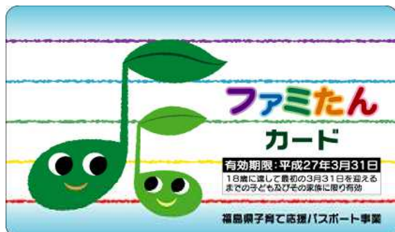
パスポートカード他県交付用[86mm×54mm]4色表面 (広域連携している県の県民が使用するカード)